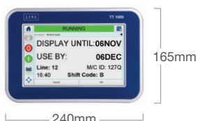
CONTRÔLEUR VUE DE FACE